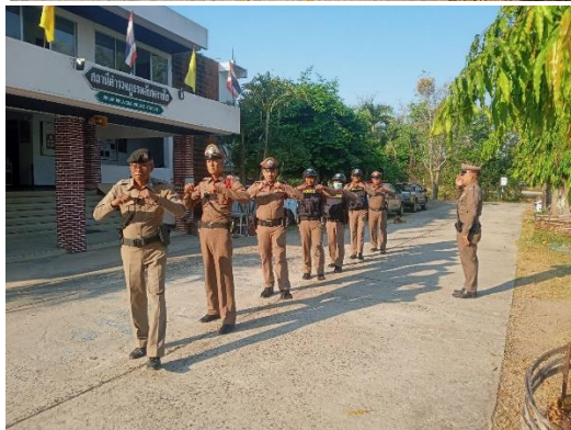
การออกตรวจตามแผนการตรวจ